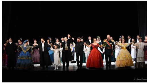
Evgheni Oneghin, aplauze